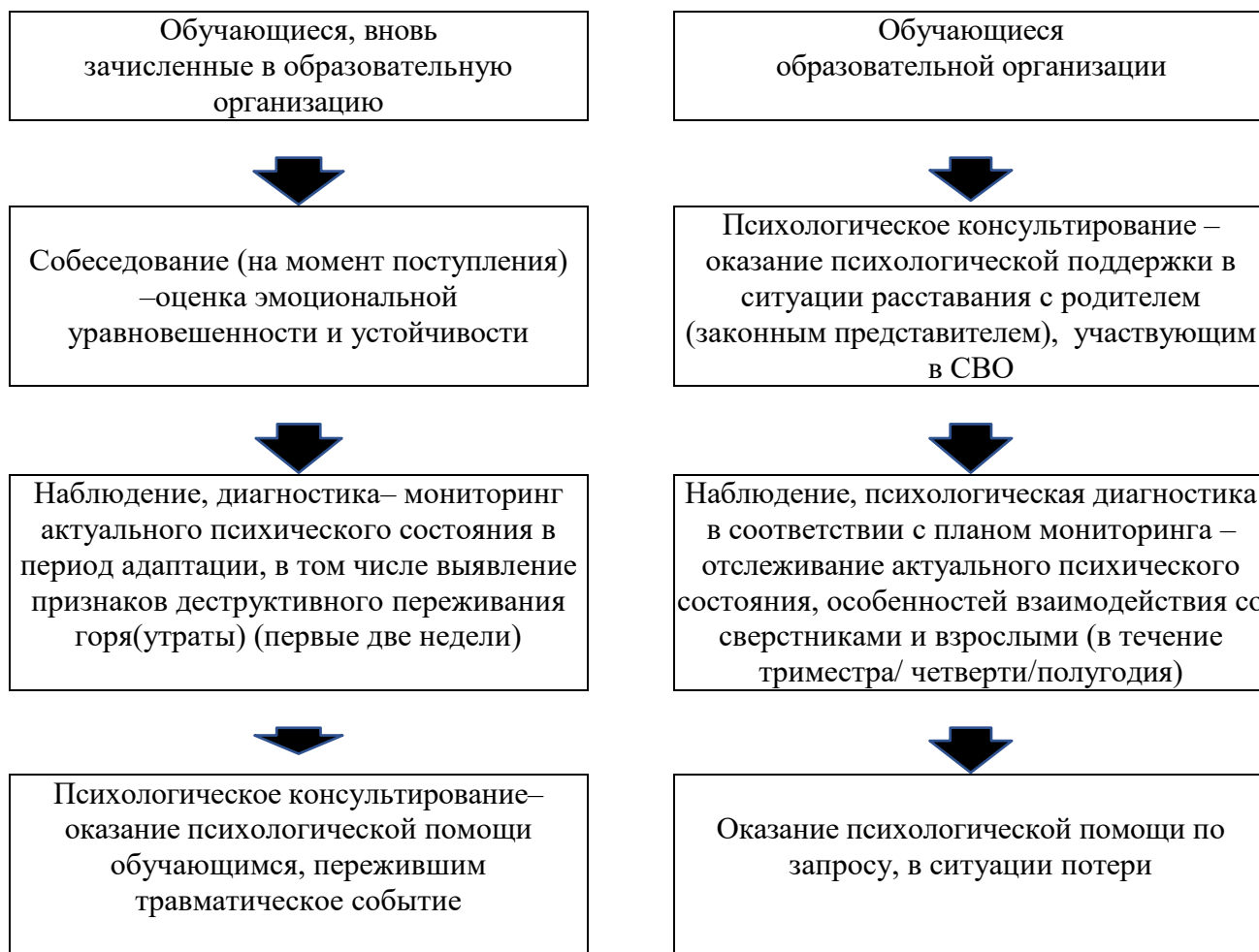
Схема выстраивания работы педагогов по педагогическому сопровождению детей ветеранов(участников)СВО в зависимости от статуса пребывания обучающегося в образовательной организации